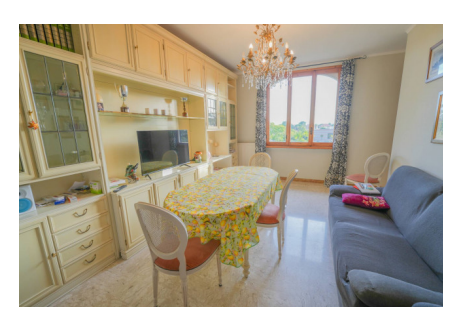
RIF. 13855 - PREIS: € 420.000 - MQ 106

Bordighera, in einer ruhigen Gegend, nicht weit vom Zentrum entfernt, bieten wir eine Immobilie zum Verkauf an, die sich im ersten Stock einer Vierfamilienvilla mit unabhängigem Eingang befindet. Die Wohnung, mit einer Fläche von ca. 89 qm im ursprünglichen Zustand, ist in gutem Zustand und wie folgt aufgeteilt: Eingangsbereich, großes und helles Wohnzimmer mit Zugang zur nach Süden ausgerichteten Terrasse, Wohnküche ebenfalls mit Zugang zur Terrasse, Flur, der zum Schlafbereich führt, wo sich zwei Schlafzimmer mit Balkon und zwei Fensterbäder befinden. Zur Immobilie gehört außerdem ein Studio im Erdgeschoss mit separatem Eingang sowie eine große Garage von ca. 35 qm im Untergeschoss. Die Wohnanlage besteht aus zwei Vierfamilienvillen und bietet ein angenehmes Umfeld mit gemeinschaftlichen