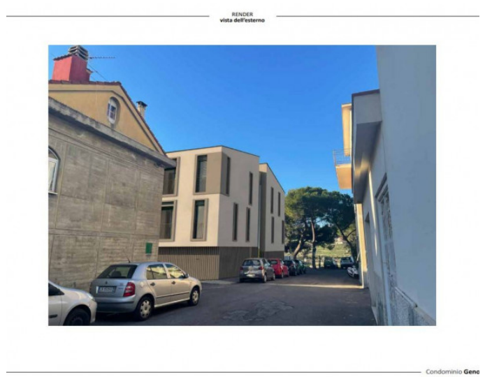
RENDER vista dall'esterno